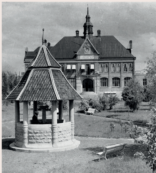
Tingshuset och sandstensbrunnen år 1916.

Kung Gustavs väg 1 0250-55 22 61 kultur@orsa.se @orsakulturhusochbibliotek