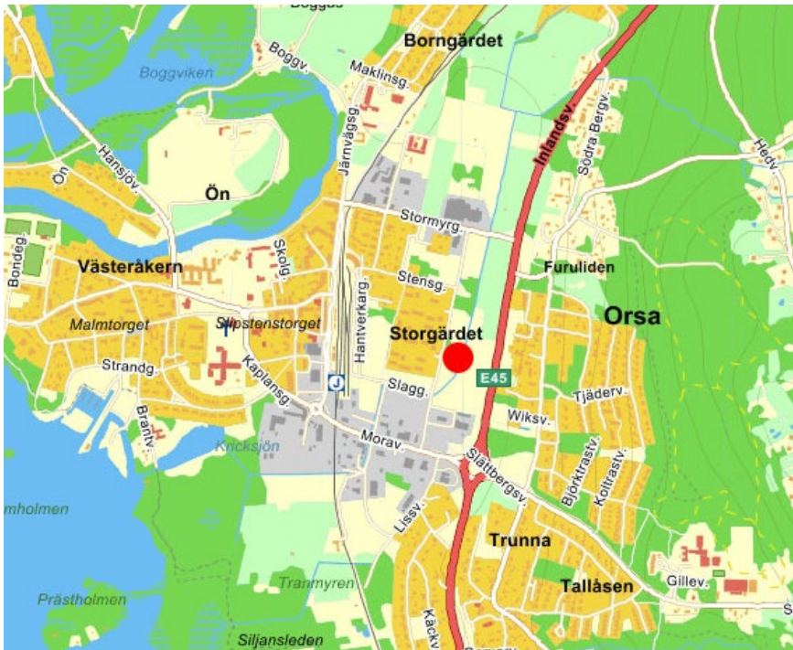
Planområdets läge i Orsa

Föreslagen markanvändning utgör en samhällsviktig verksamhet. Marknivån för byggnader och utrymningsvägar ska därmed enligt länsstyrelsens riktlinjer anpassas till att klara översvämning upp till nivån för högsta beräknade flöde (+166,8 m (RH2000)).